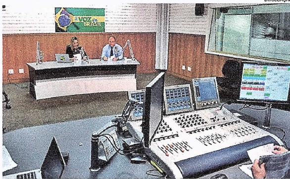
Há 75 anos, a Voz do Brasil, programa radiofônico da EBC, começa exatamente às 19h em todo o país

No ar há 75 anos, de segunda a sexta-feira, às 19 horas, a Voz do Brasil pode mudar de horário. Projeto de Lei já aprovado pela Câmara e aprovado recentemente pela Comissão de Ciência e Tecnologia do Senado permite a flexibilização do horário de transmissão do programa. Pelo parecer do senador Antônio Carlos Magalhães Júnior (DEM-BA), a Voz poderá ser veiculada entre 19 e 23 horas. As emissoras públicas e educativas ficam obrigadas a manter o horário atual, e as emissoras do Poder Legislativo poderão flexibilizar se estiver ocorrendo votação plenária. A proposta, no entanto, divide a opinião de deputados e especialistas. O deputado José Rocha (PR-BA), que foi relator do projeto na Câmara, é favorável à flexibilização.