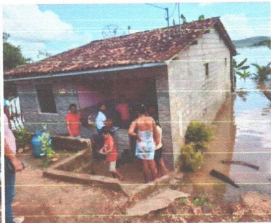
Distribuição de água e cesta básica nos povoados.